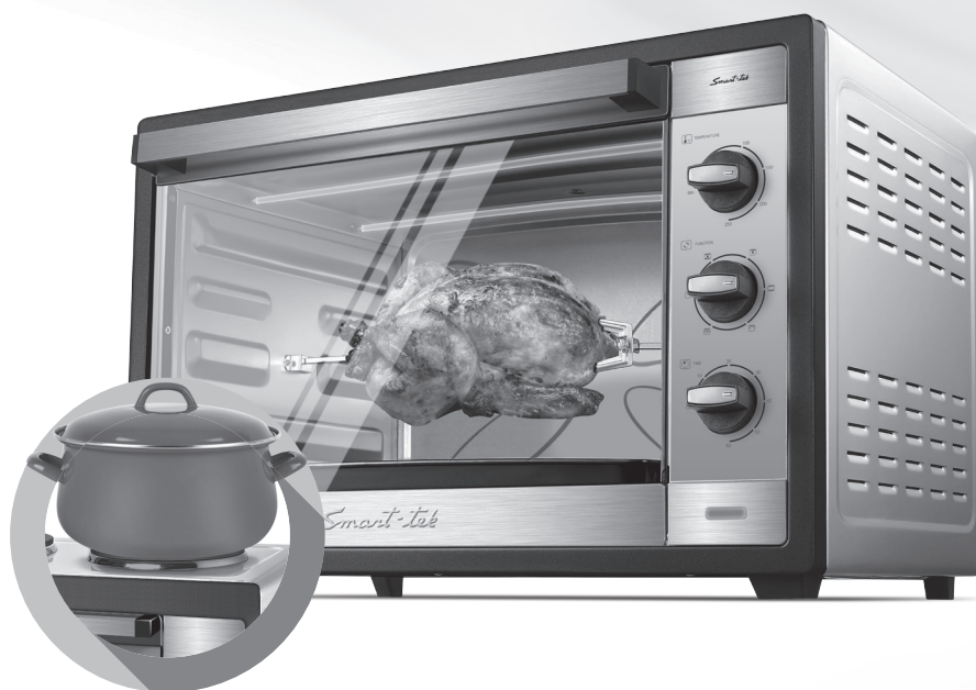
HORNO ELÉCTRICO MODELO SD 6060 B