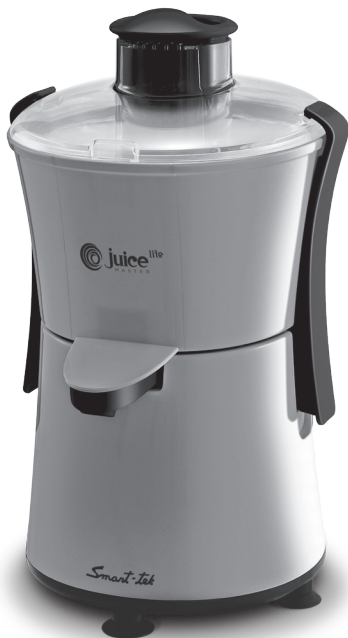
Juice Master Lite